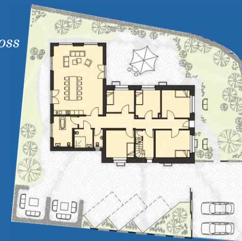
Erdgeschoss & Garten

Das idyllisch gelegene Anwesen bietet modernen Komfort und überzeugt durch sein häusliches Ambiente.