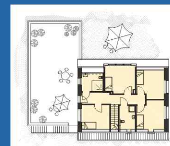
Obergeschoss & Dachterrasse